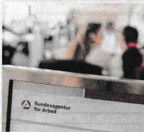
In deutschen Jobcentern gibt es weniger Personal als offiziell angegeben.

Dabei spiegelten selbst die von der Bundesregierung nun eingeräumten Zahlen nicht die wahre Situation. Tatsächlich würden mindestens 162 000 erwerbsfähige Leistungsberechtigte mit geringen eigenen Einkünften nicht in die Ermittlung der Betreuungsschlüssel einfließen. Auch die wachsende Zahl arbeitsuchender Flüchtlinge in der Grundsicherung sei nur zum Teil von der Bundesregierung berücksichtigt, die sich in ihrer Antwort auf den Stand Ende 2016 beziehe. Seither seien rund 130 000 Menschen hinzugekommen, die einer besonders intensiven Betreuung bedürften. „Legt man näherungsweise zur Berechnung der tatsächlichen Lage alle aktuellen erwerbsfähigen Leistungsberechtigten zugrunde, ergäbe sich für den Bereich der unter 25-Jährigen ein Betreuungsschlüssel von 1 zu 198 und für über 25-Jährige von 1 zu 208“, so Pothmer. Um den Herausforderungen gerecht zu werden, bedürfe es eines Bürokratieabbaus und zusätzlichen Personals.